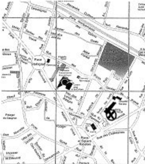
exemple de plan de situation

3- Un plan de masse des constructions indiquant les façades concernées par le ravalement.